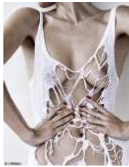
Réveillez vos endorphines !