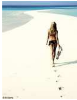
Les grands principes de l'équilibre a...